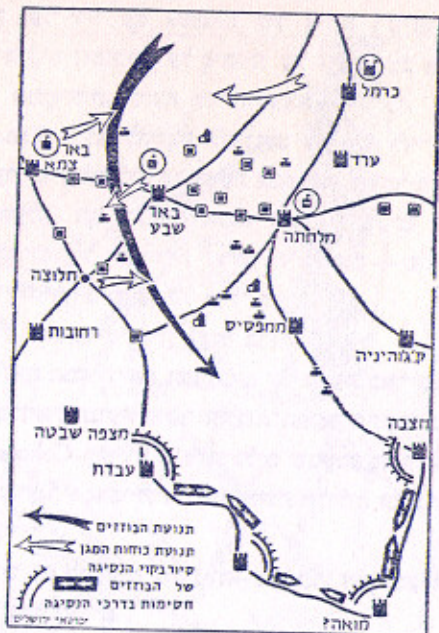
ציור 3. השמדת בוזזים החוזרים דרך הלימס, אם לא היה סיפק לבלום את פשיטתם לפנים הארץ.