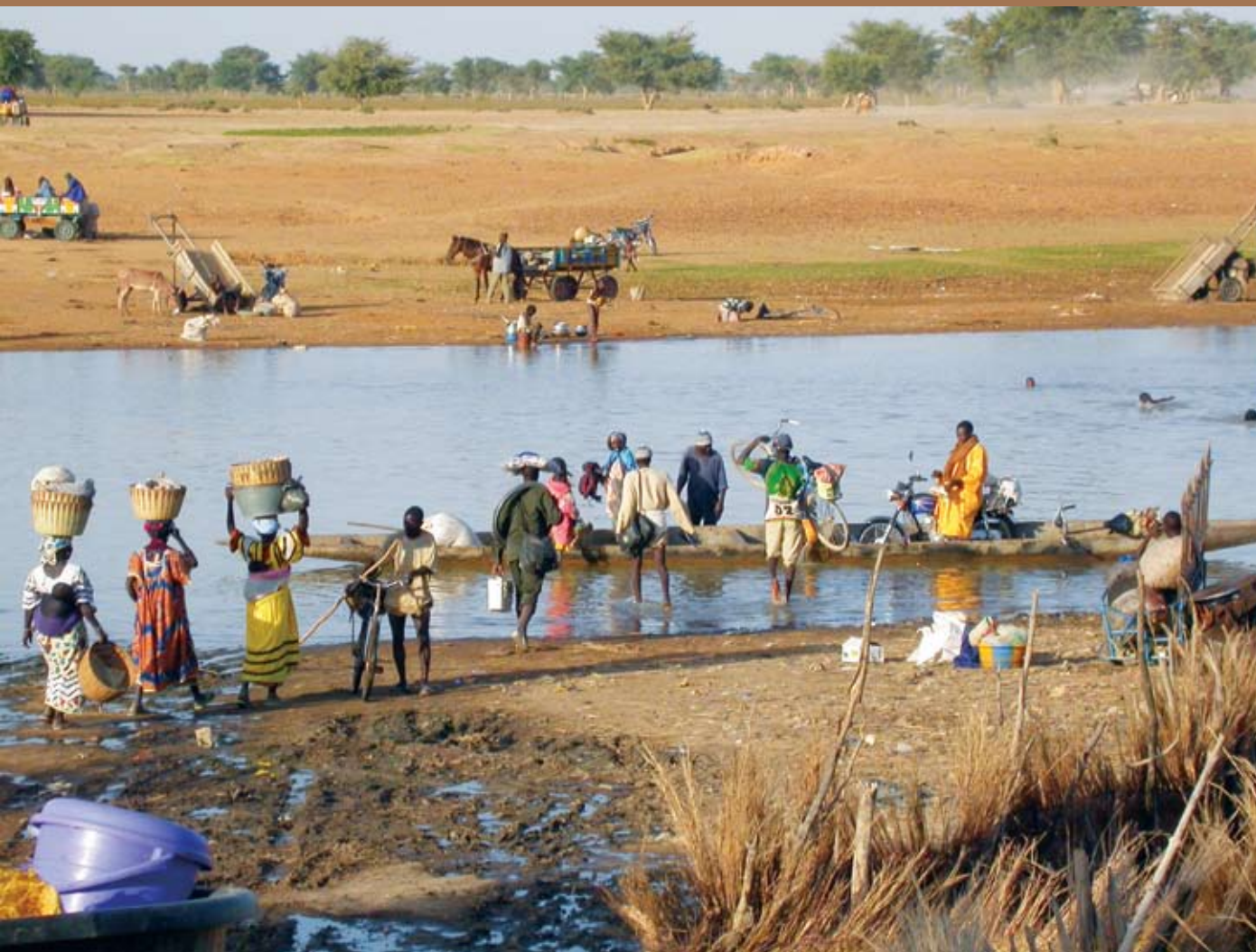
חציית אחד היובלים של הדלתא העליונה של הניג'ר המקיפה את העיר ג'אנה. יום שני הוא יום השוק בעיר, והתושבים מגיעים בכל אמצעי התחבורה.

יהודי משיידה, מרוקו. בני המשפחה הקימו שלושה כפרים שקיימים עד ימינו באזור טימבוקטו: קירשמבה, היומבו וקונגורה. בשנת 1492, עלה אסקיה מוחמד לשלטון בטימבוקטו, הוציא את היהדות מחוץ לחוק במאלי והכריח את יהודי האזור להתאסלם. משפחת קהת התאסלמה יחד עם שאר בני הקהילות שאינן מוסלמיות.