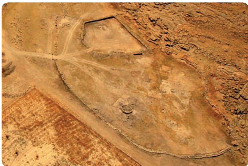
ביד'ת א־שעב, תצלום מהאוויר.