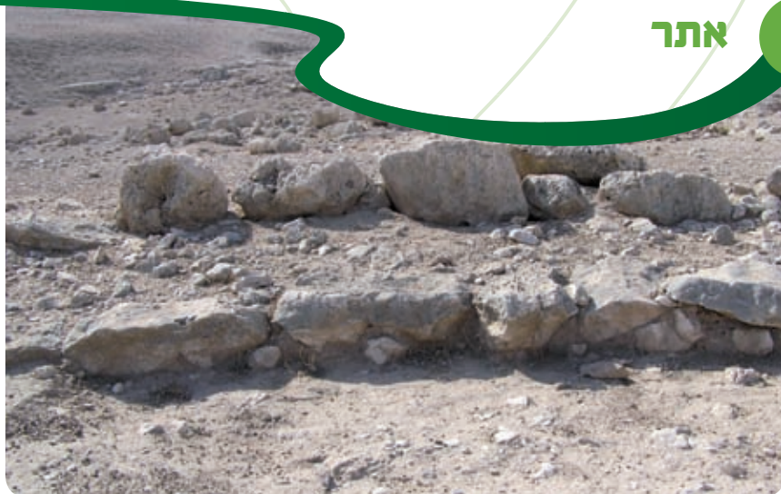
קטע מדרך התהלוכות בשטח B.