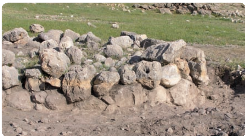
הבמה העגולה לאחר חשיפתה בשטח A.

אירוע יוצא דופן בתולדות העם, הנעדר מספרי המקרא האחרים. באירוע זה מתואר מעבר המשכן משילה, שנחרבה על ידי הפלישתים (במאה ה־11 לפנה"ס), לאזור אדם העיר: "ויטש משכן שילה אהל שכן באדם" (ע"ח, ס). לפסוק זה שני חלקים מקבילים ומשלימים: ויטש = שכן; משכן = אהל; שילה = אדם. לדעת כותב המאמר, לא סביר שמשכן בני ישראל עבר משילה לאדם העיר, שהרי עיר זו נמצאת בעבר הירדן המזרחי - מקום שנחשב תמיד מחוץ לגבולות הארץ המקודשת (השוו למשל: עונשו של משה, שלא חצה את הירדן מערבה). לפיכך יש להבין את הפסוק הנ"ל כהעברת אוהל מועד לבקעת הירדן המערבית, לאזור אדם העיר, למתחם המיוחד של ביד'ת א־שעב, הממוקם כ־6 ק"מ צפונית־מערבית לתל א־דמיה.