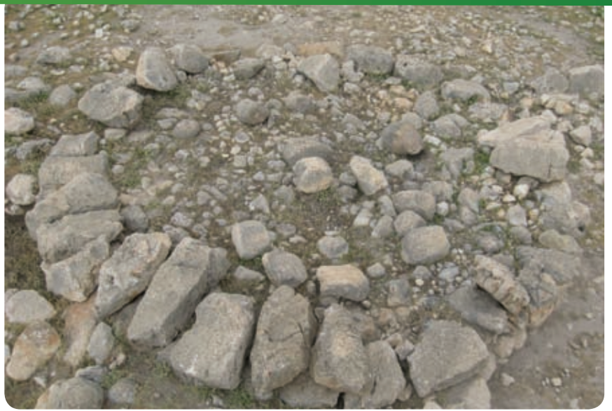
הבמה העגולה בשטח A, מבט על.