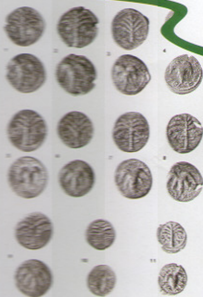
מטבעות מרד בר כוכבא.