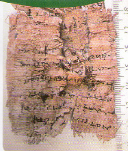
פפירוס כתוב ביוונית.