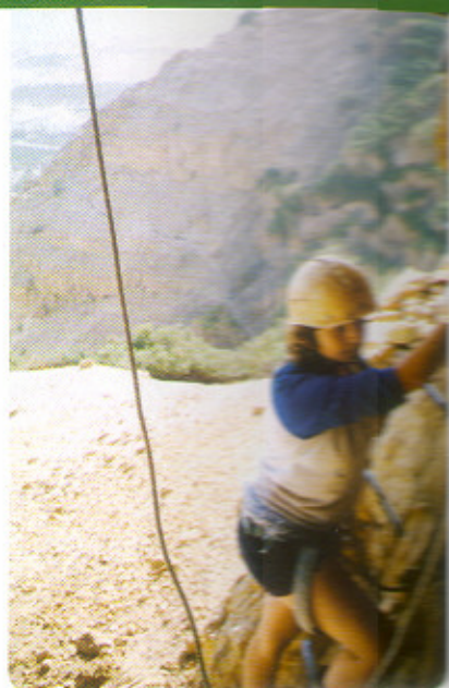
העיסה למערת הר ישי.