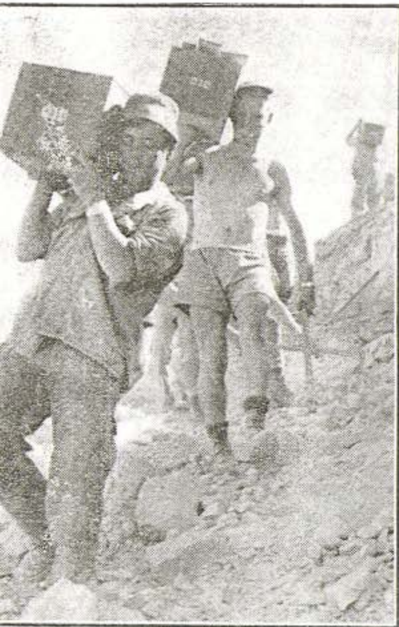
אנשי הסיירת והקיבוצניקים בעבודתם בדרך יעלים