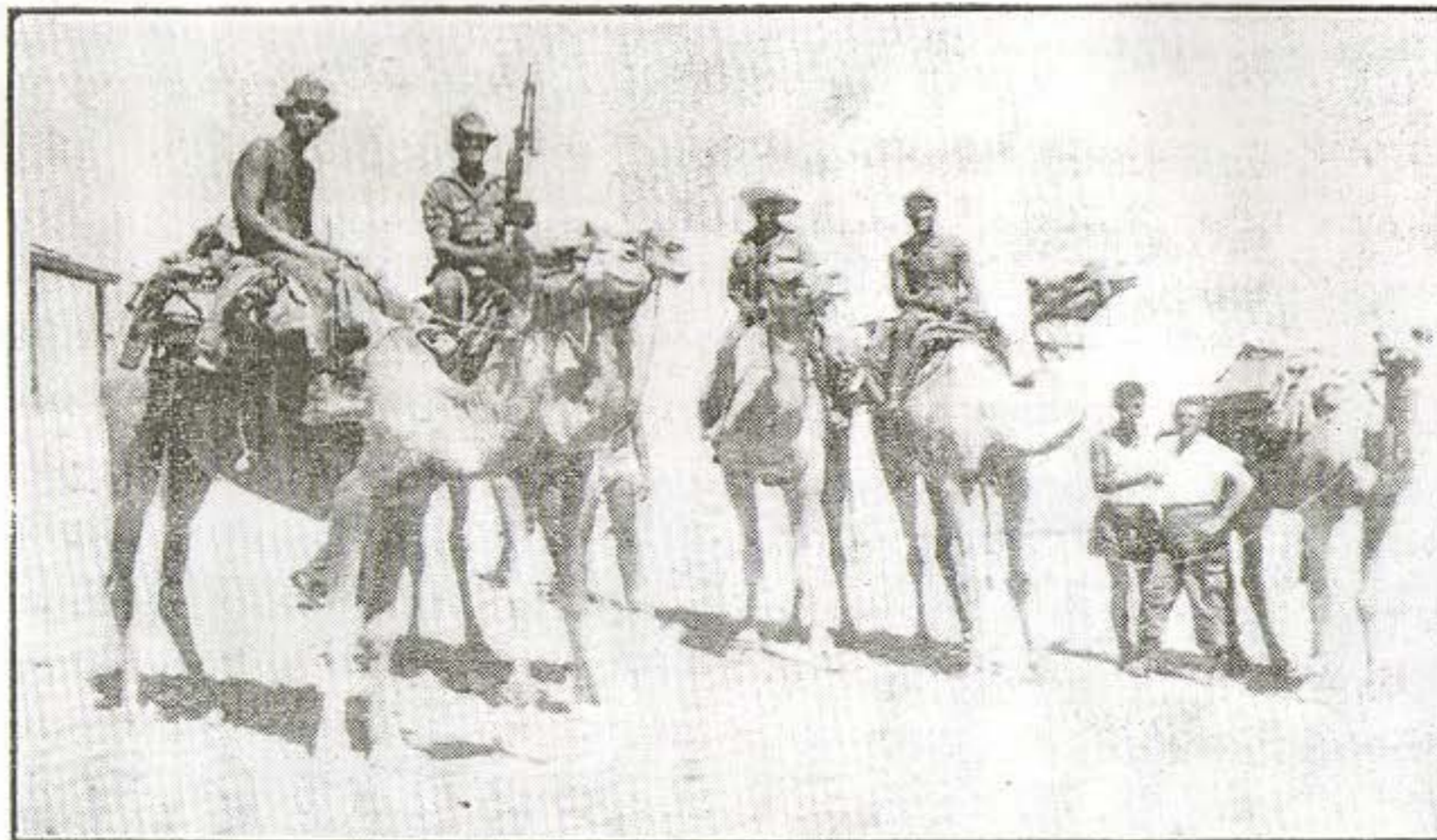
חיילי הסיירת וגמלים שעל דבשותיהם הותקנו חיצובות לירי מיקלעים